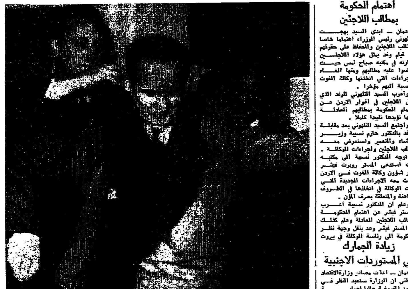
احد مساعدي الدكتور غونار يارينغ يلبسه معطفه بعد انتهاء محادثته مع السيد محمود رياض وزير خارجية الجمهورية العربية المتحدة في زيارته الطارئة للقاهرة بعد العدوان الاسرائيلي على الزواجر المصرية التي تقوم بمسح قناة السويس